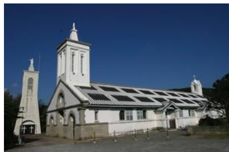
(普通車 6台、大型バス 3台)